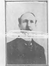
Luis Octavio Diviñó, Comisionado por el Ejecutivo