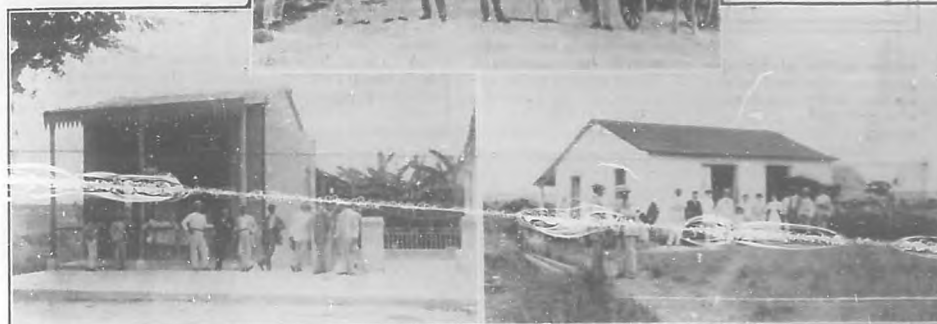
EL SOLAR DE BOHEMIA.—Vista de la calzada donde está el reparto Mantilla propiedad del Sr. Berenguer.—Dos aspectos de fabricación en el referido reparto, donde se encuentra el solar de 5 x 20 de equina que sorteará Bohemia entre sus abonados el día 30 del mes actual.—Foto de José López y López.

tantes, infinitas mudanzas de los residentes habaneros, quienes durante los doce meses del año están casi mensualmente bailando unos lanceros con sus muebles,—¡pobres muebles, cuanto sufren! tendrá su término el día en que la mayoría de los mismos habaneros tengan su casa propia. Y no digan que la distancias hacen difícil la adquisición, pues aparte de que las ciudades hay que dejarlas al movimiento comercial y de diversiones, los tranvías han acortado las distancias de tal modo, que ya la Vibora hoy y las montañas de San Juan mañana, serán la prolongación de de la Habana, y día vendrá en que serán el "dormitorio de la capital" pues es donde se encontrará silencio, tranquilidad, aire, luz.