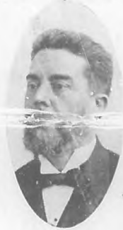
Eliseo Giberga, Comisionado por el Ejecutivo