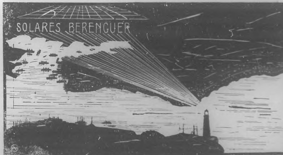
EL REGALO DE BOHEMIA.—Dibujo por el que puede darse idea del espléndido lugar que ocupan los solares de Berenguer, como desde la Habana, uno de los cuales sorteará Bohemia el día último del mes actual, entre sus abonados que están al corriente en sus pagos.