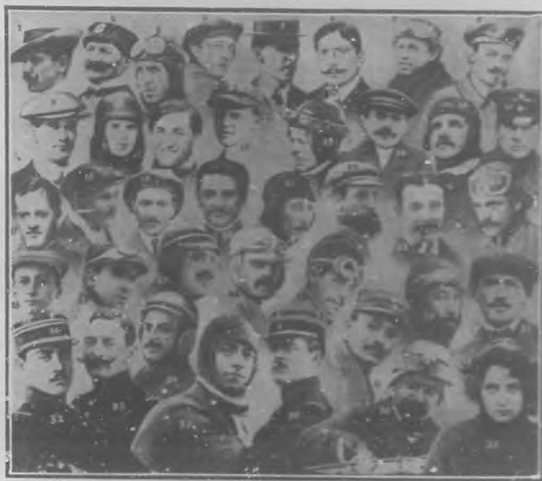
Victimas del aire