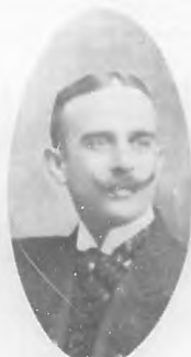
Carlos Armenteros, Comisionado por la Cámara de Representantes