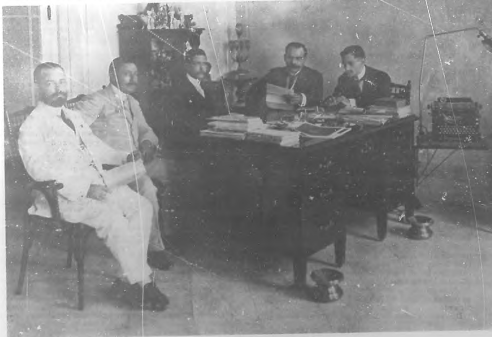
Comisión organizadora del Primer Congreso Odontológico Cubano.